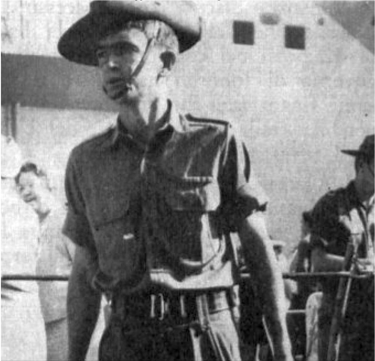
Dall' Astrolabio n. 29 del 1967