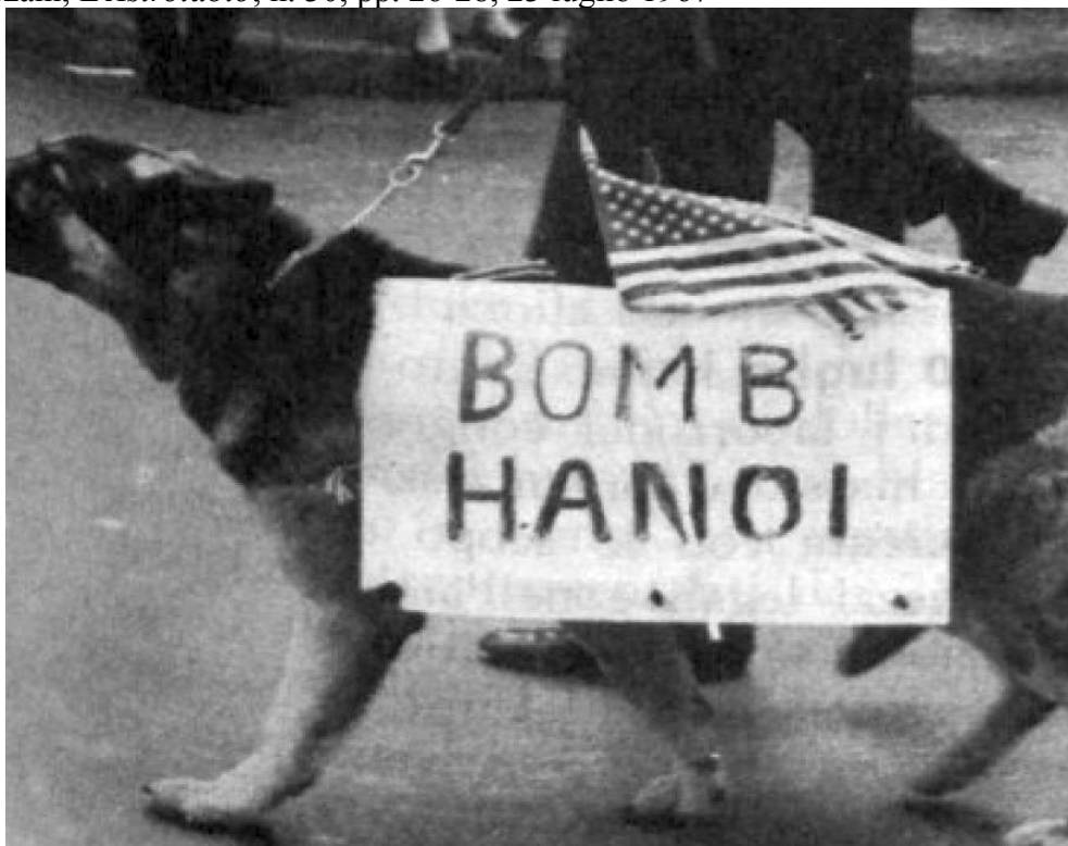
Dall' Astrolabio n. 30 del 1967.

Tiziano Terzani, L'Astrolabio , n. 30, pp. 26-28, 23 luglio 1967