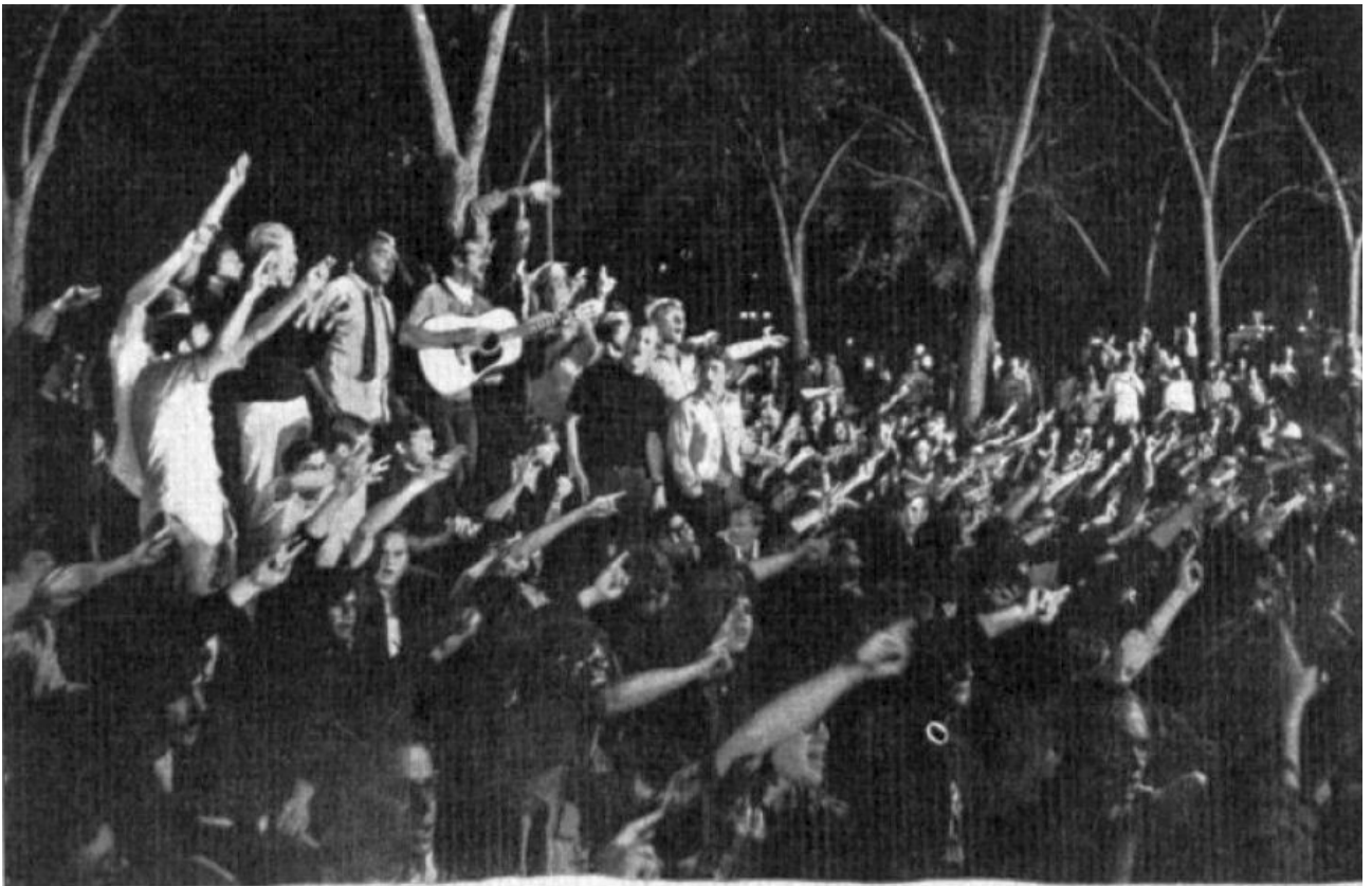
Chicago: i canti di protesta