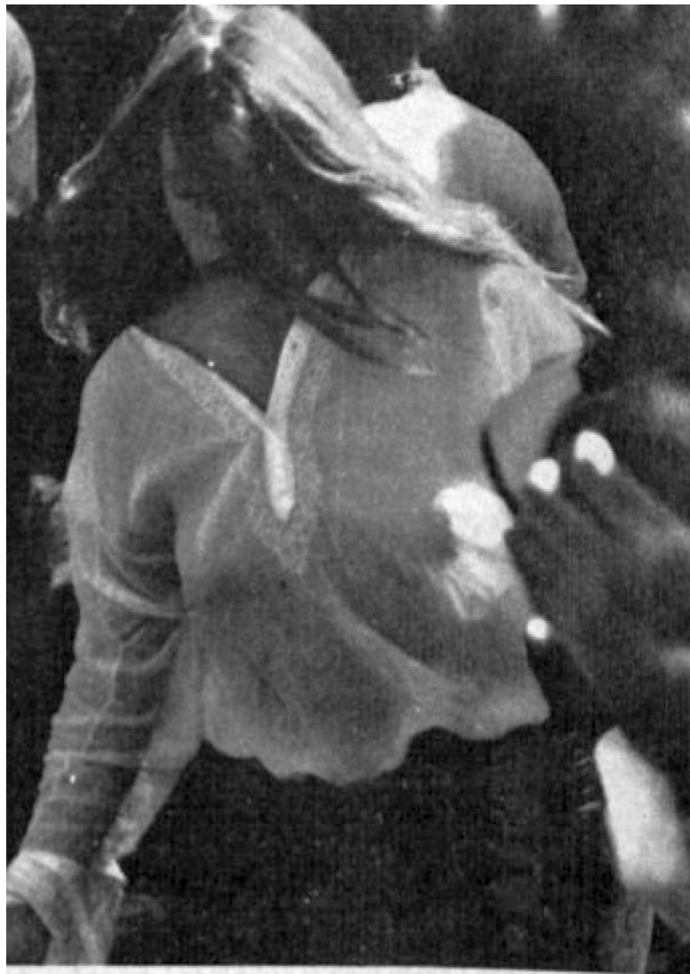
Chicago: dopo lo scontro