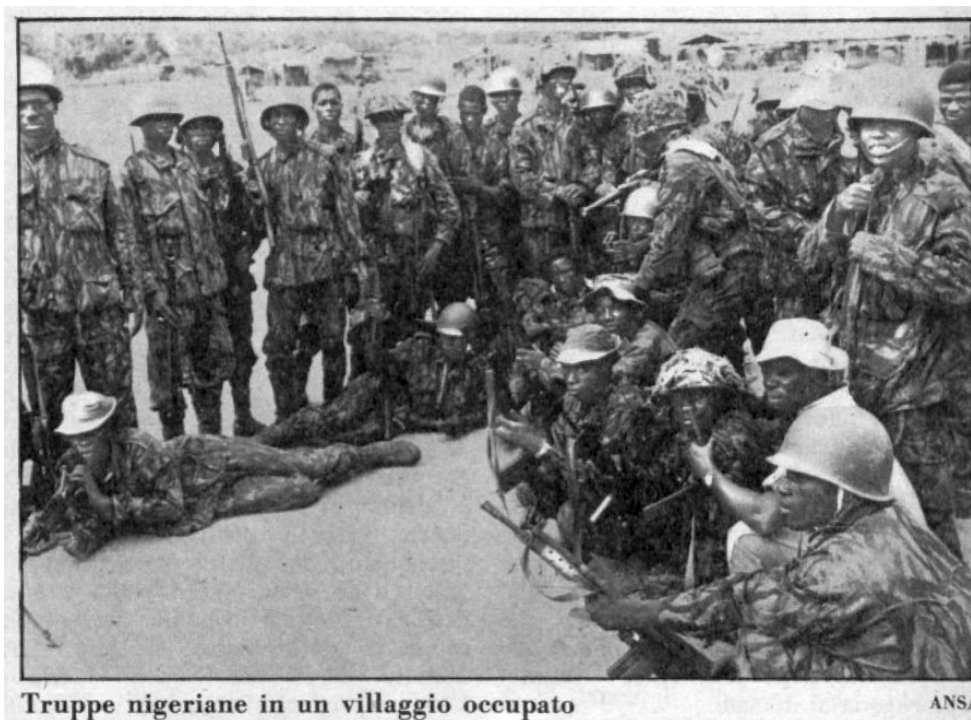
Truppe nigeriane in un villaggio occupato