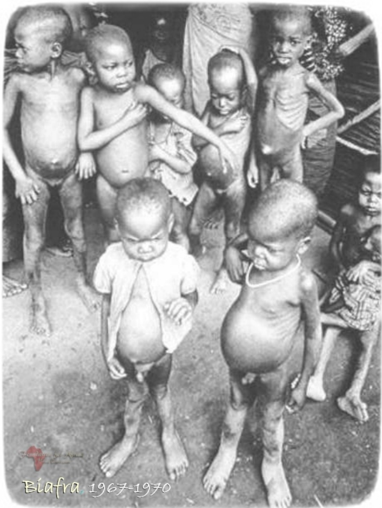
Fondazione per l'acqua Biafra 1967-1970