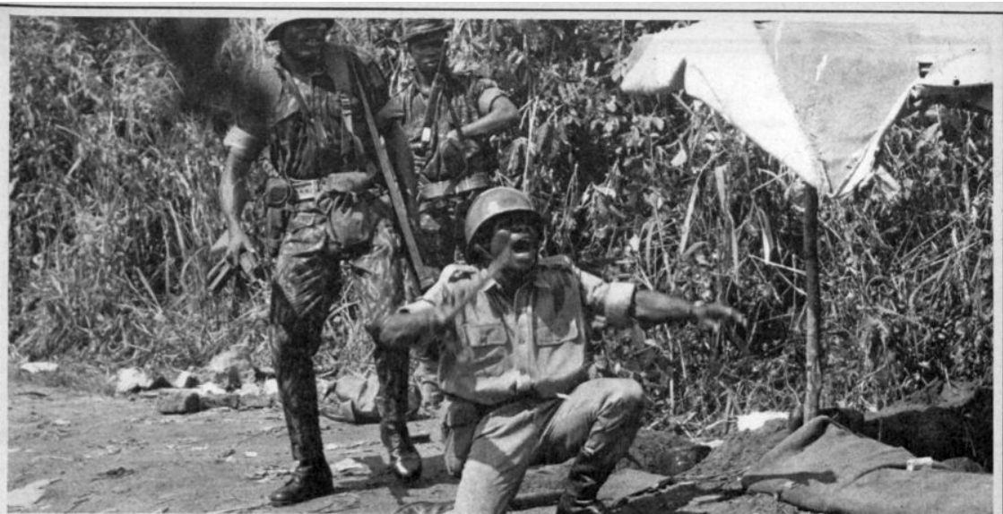
Fronte nord: esercitazioni dei soldati federali pochi giorni prima della guerra