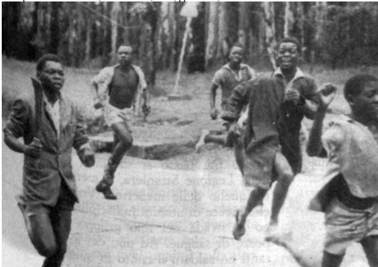
Dall' Astrolabio n. 35 del 1967.