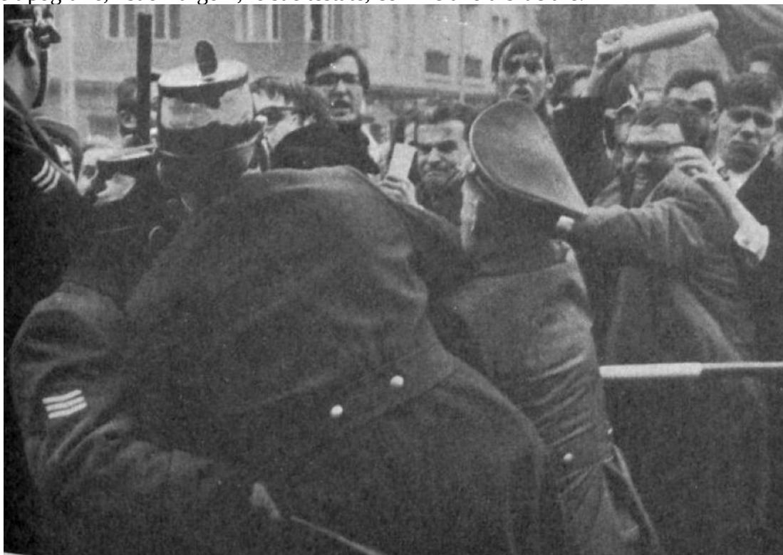
FRANCOFORTE, APRILE '68: gli studenti hanno imparato a picchiare

E le sue tipografie, i suoi furgoni, le sue testate, cominciano a bruciare.