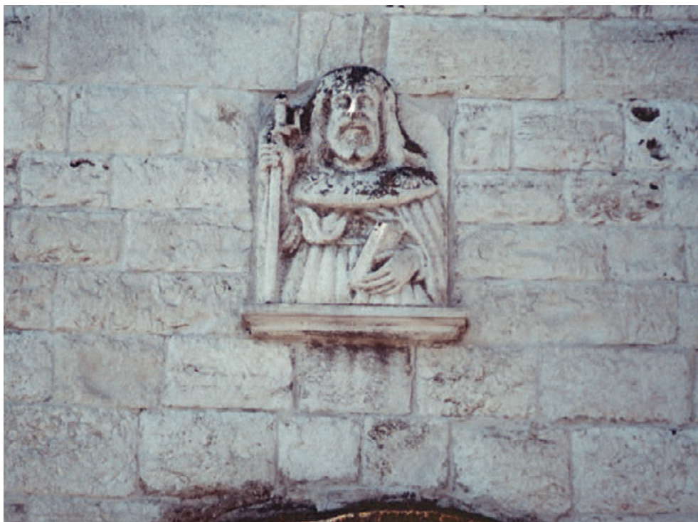
Fig. 3. Barletta, chiesa di San Giacomo, facciata, San Giacomo.

Nell'importante scalo marittimo di Barletta, la chiesa benedettina di San Giacomo (Fig. 2) "extra portas Baruli" 66 , è ubicata nel Borgo omonimo, attraversato dalla via litoranea che da Siponto conduceva a Brindisi. Dipendente dall'abbazia della SS.ma Trinità di Monte Sacro (Mattinata), possedeva anche un ospedale per pellegrini e un cimitero.