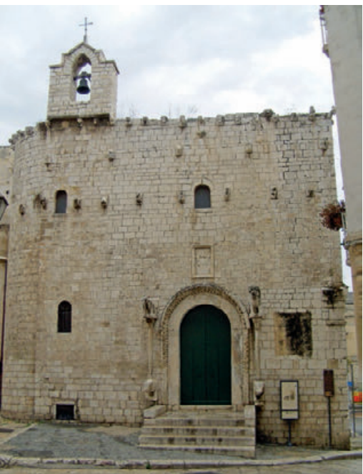
Fig. 6. Trani, Chiesa di San Giacomo, già di Santa Maria de Russis, facciata.