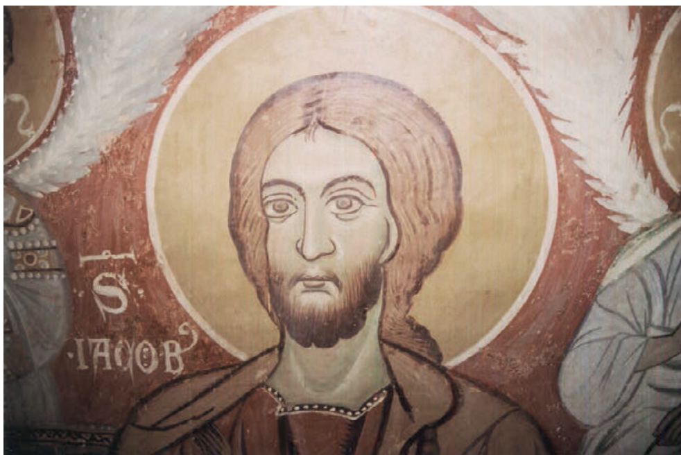
Fig. 19. Brindisi, Chiesa di Santa Maria del Casale, controfacciata, San Giacomo apostolo.