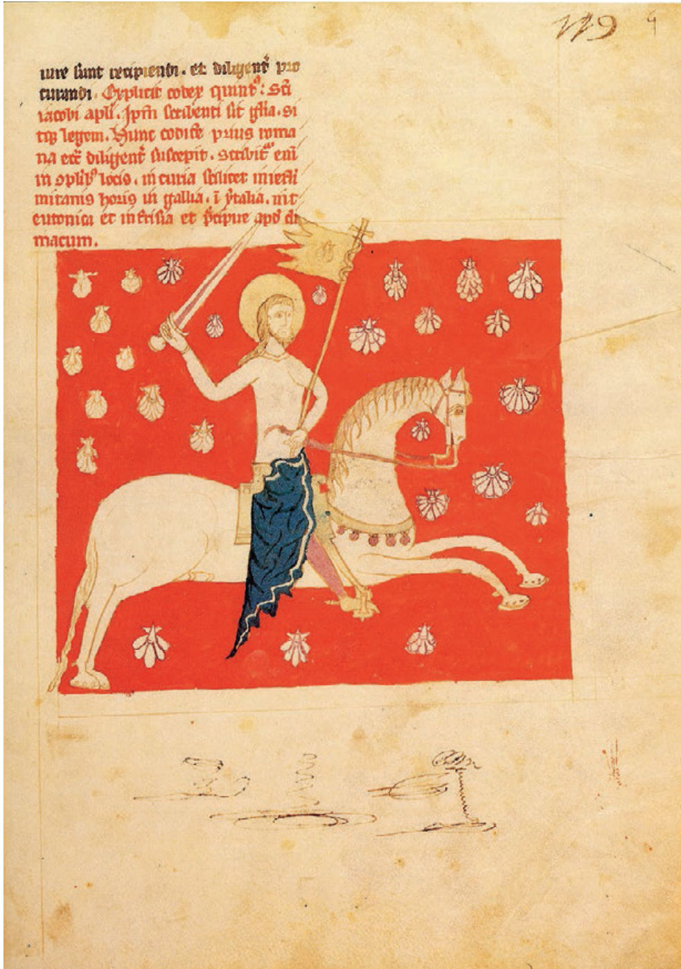
Fig. 17. San Giacomo cavaliere, Liber Sancti Iacobi , Salamanca, Biblioteca Universitaria, Ms. 2631.