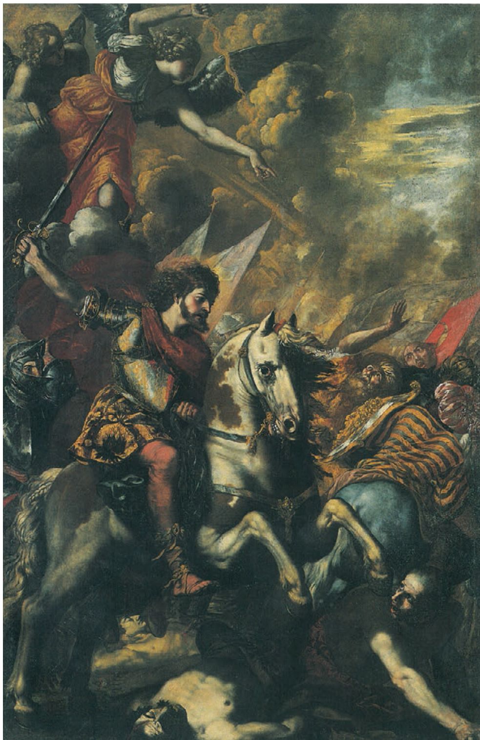
Fig. 11. Monopoli, cattedrale, Carlo Rosa, San Giacomo Matamoros.