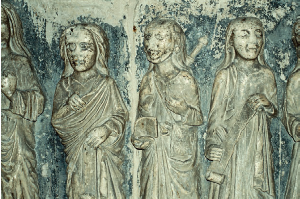
Fig. 9. Molfetta, duomo di San Corrado, San Giacomo Apostolo.

scarsella 77 (Fig. 9). Quintavalle 78 legge nell'insieme di lastre con Cristo tra gli Apostoli, un vescovo e un diacono, elementi appartenenti alla recinzione presbiteriale del duomo. Coglie una cultura diversa da quella presente in Puglia e ravvisa vicinanze con la scultura campionesa in Italia settentrionale. In particolare, come riferimento diretto propone l'opera del Maestro dell'Arca di Abdon e Sennen, ora collocata come altare maggiore nel presbiterio della cattedrale di Parma, databile attorno agli anni Ottanta del XII secolo.