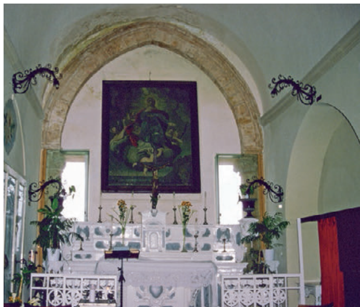
Fig. 14. Ostuni, Chiesa di San Giacomo di Compostella, interno.