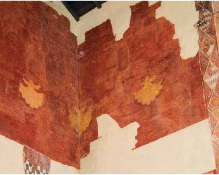
Fig. 15. Brindisi, Chiesa di Santa Maria del Casale, braccio destro del transetto, Affresco con conchiglie (Foto di Giulia Perrino).