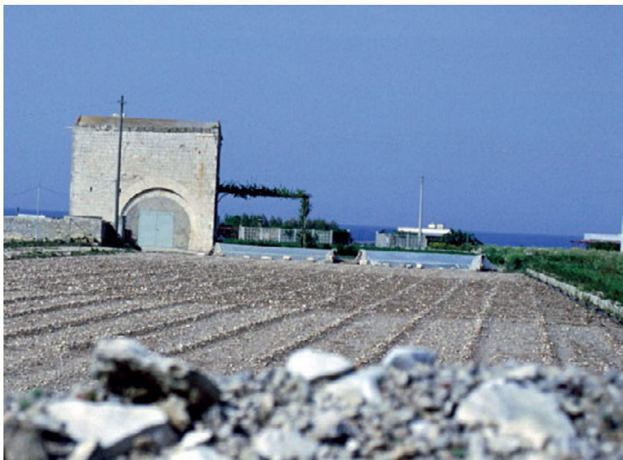
Fig. 7. Molfetta, struttura superstite dell'ospedale di San Giacomo.

A Trani, la chiesa di Santa Maria de Russis 71 (XII secolo) (Fig. 6), non lontana dal castello, accanto alla Porta Vetere, venne successivamente intitolata a San Giacomo. E' ubicata in prossimità dell'attuale via Mario Pagano, in asse con la via proveniente da Barletta che costituiva l'accesso al nucleo medievale per coloro che giungevano da Nord. Il mutamento di dedicazione avvenne probabilmente nel XVII secolo 72 , con il trasferimento nell'edificio della confraternita di San Giacomo Maggiore, costituita soprattutto da pescatori e un tempo ospitata nella piccola chiesa di San Giacomo nei pressi del porto, poi distrutta.