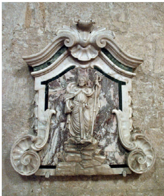
Fig. 4. Barletta, chiesa di San Giacomo, San Giacomo pellegrino, XVIII secolo.