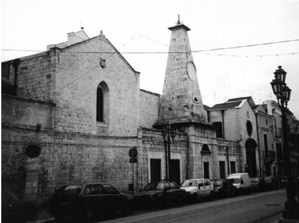
Fig. 2. Barletta, San Giacomo.

Nello stesso territorio era attestata la presenza di reliquie del Santo: nel 1457 l'Arcivescovo di Siponto Giovanni Burgio (1449-1458) dona alla chiesa di San Giacomo di Caltagirone, suo paese natale, un frammento dell'osso del braccio assieme ad altre reliquie 64 . Reliquie di Sanctus Iacobus Apostolus sono citate inoltre negli Inventari del Monastero di Santa Maria delle Tremiti 65 .