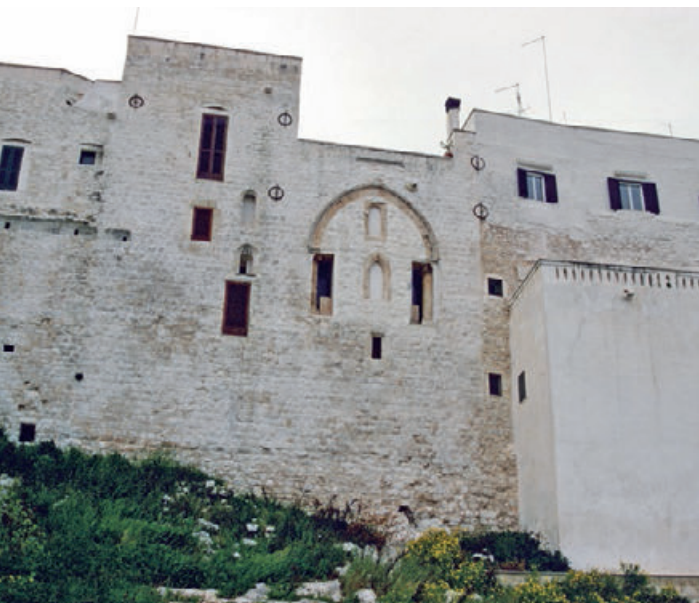
Fig. 13. Ostuni, Chiesa di San Giacomo di Compostella, parete absidale.