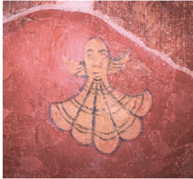
Fig. 16. Brindisi, Chiesa di Santa Maria del Casale, Affresco palinsesto con conchiglie, particolare.

vermiglio è seminato di conchiglie di S. Giacomo di Compostella; in basso l'insegna riappare sul lembo della gualdrappa di una cavalcatura (solo in parte visibile) che evoca la nota scena del Miracolo di Santiago e due pellegrini 110 . Per Gaetano Curzi si tratta invece di un omaggio di cavalieri a un'immagine mariana, forse collocata su un registro superiore 111 .