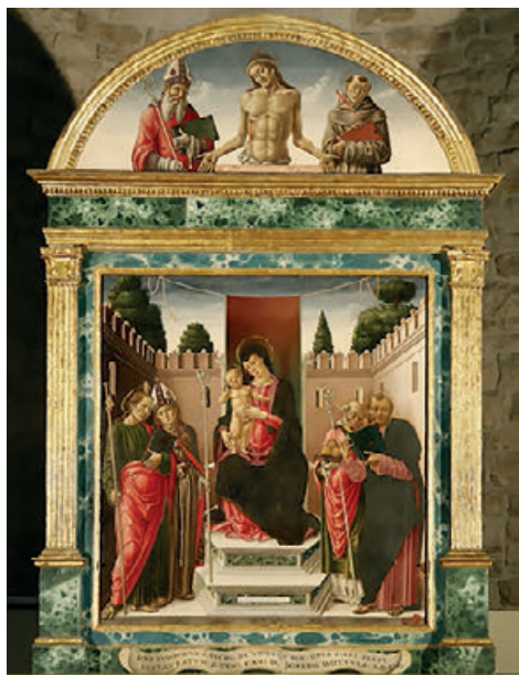
Fig. 10. Bari, basilica di San Nicola, Bartolomeo Vivarini, Madonna con Bambino in trono tra i Santi Giacomo, Ludovico, Nicola e Marco.

vata unica, ha lavorato nei primi decenni del XVIII secolo l'architetto napoletano Domenico Antonio Vaccaro, attivo anche nel rifacimento della cattedrale di Bari. L'intervento è consistito nel ricco apparato di stucchi, nel pavimento di maiolica, negli altari marmorei 81 . L'altare maggiore in marmi policromi disegnato dal Vaccaro e realizzato dal marmoraro Carlo Tucci, presenta sul paliotto l'immagine di san Giacomo in un medaglione, a parere di Mimma Pasculli eseguito da Vaccaro prima della sua morte (1745) e inserito nel manufatto dal Tucci 82 . Nella basilica di San Nicola, la tavola di Bartolomeo Vivarini 83 (1476) (Fig. 10) colloca a sinistra della Madonna in trono san Giacomo e san Ludovico di Tolosa, a destra san Nicola e san Marco, in una disposizione topografica che rispecchia i santi