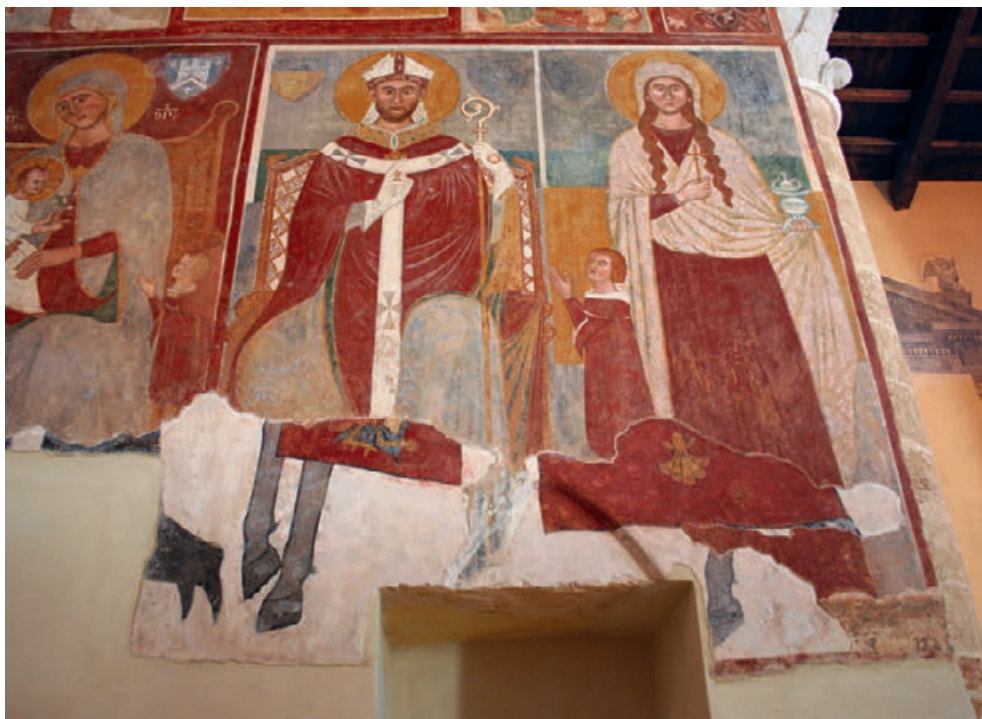
Fig. 18. Brindisi, Chiesa di Santa Maria del Casale, Affresco palinsesto con conchiglie (Foto di Giulia Perrino).