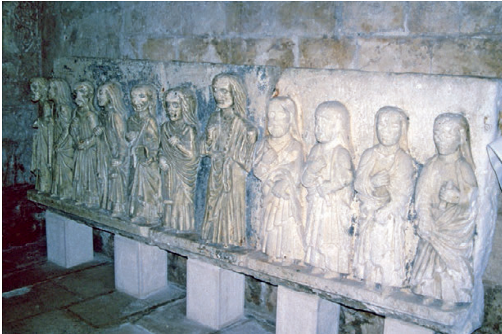
Fig. 8. Molfetta, duomo di San Corrado, Cristo e gli apostoli.

nel 1139, quando Leone, figlio di Maraldo, dona alla chiesa un oliveto prima di recarsi in pellegrinaggio a Santiago (Archivio dell'Abbazia della SS. Trinità di Cava dei Tirreni, XXIV, 81) e ancora nel 1143 come dipendenza dell'abbazia di Monte Sacro. Nel 1180 l' hospitale era già completato 74 e nel 1198 Innocenzo III assegna il complesso a Santa Maria di Calena. Nel 1252 era stato già restituito a Monte Sacro 75 . Del complesso sopravvive ora solo la campata del portico antistante la chiesa (Fig. 7).