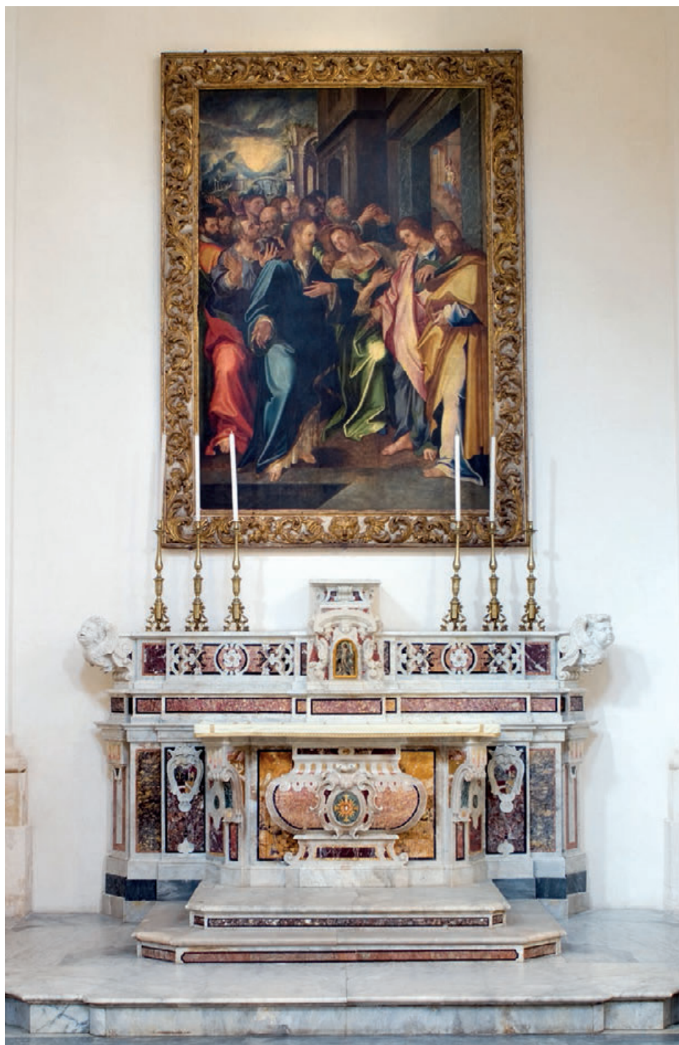
Fig. 12. Monopoli, Cattedrale, Giovan Bernardo Lama, Gesù e i figli di Zebedeo.